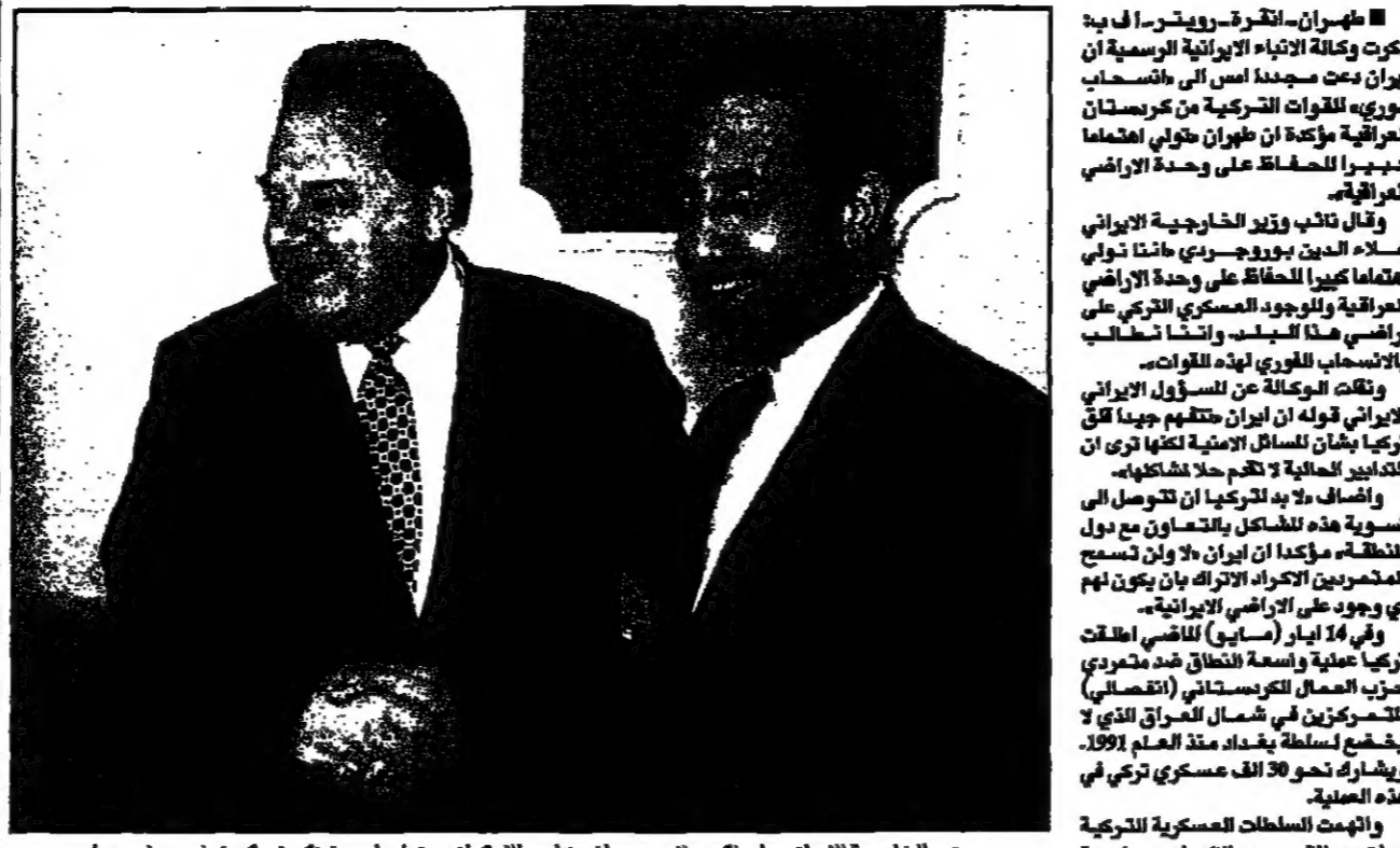
وزير الخارجية الإيراني علي اكبر ولایتی مصافح نظيره الكردي من العراق في بغداد.

طهران - انقرة - في بيان مشترك وكالات الأنباء الإيرانية الرسمية ان ايران تدعو مجددا الى انسحاب القوات العراقية من جنوب العراق والانسحاب من اربكان. وقال وزير الخارجية الايراني محمد خاتمي في بيان مشترك مع نظيره الكردي من العراق في بغداد. وقال خاتمي ان القوات العراقية من جنوب العراق والانسحاب من اربكان. وقال خاتمي ان القوات العراقية من جنوب العراق والانسحاب من اربكان.